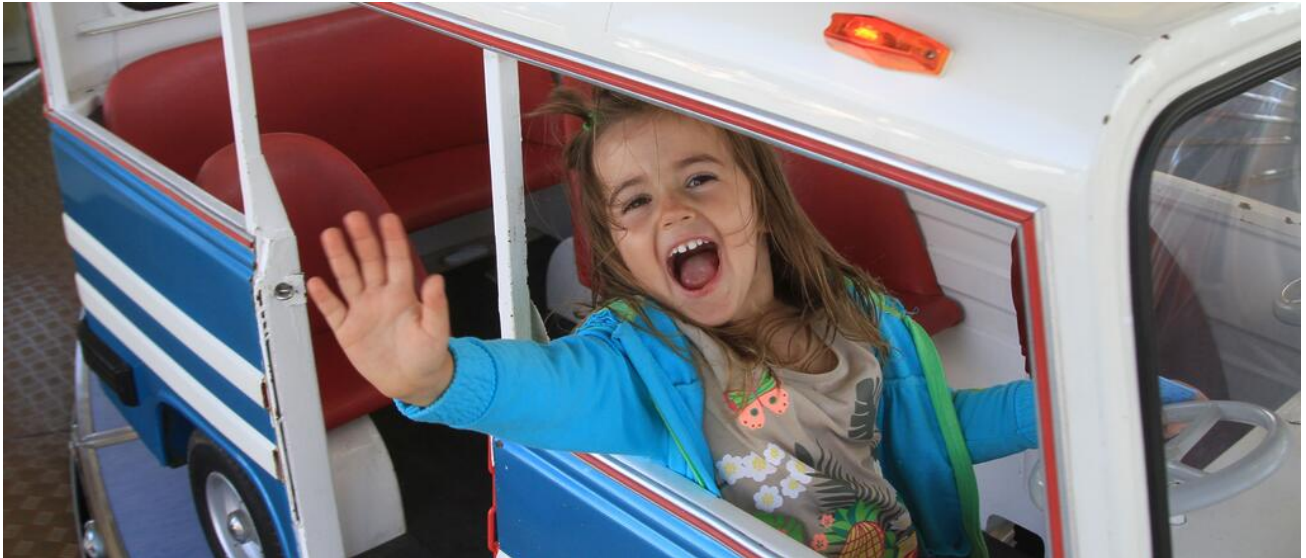
Schaustellerkinder sind Schülerinnen und Schüler auf Reisen

Seit dem Schuljahr 1996/97 ist im Freistaat Bayern die schulische Betreuung von Kindern aus Schaustellerfamilien, von Zirkusangehörigen und von fahrenden Personen neu geregelt und organisiert.